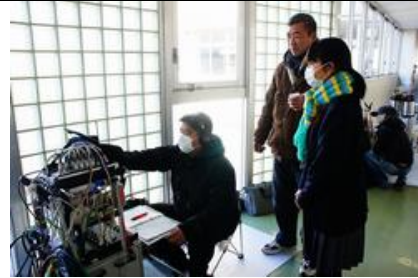
音声スタッフさんは撮影の合間に生徒に説明してくれた。