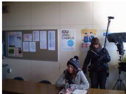
生徒指導室のリハーサル前に、スタッフが実際の場所で打ち合わせ、座っている女性はアシスタントディレクターさんである。