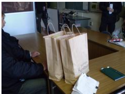
紙袋はブランド「エルクパヤ」の印刷が入ったもの