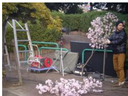
13日に用意していた桜の木である。この日は使用しなかった。実際に桜の花びらを正門付近に散らしたが、デンプン質で水に溶けてしまうもの。市販されていないとか。