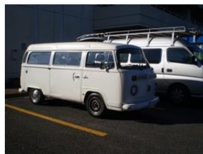
ブランド「エルクパヤ」の自動車。店舗表示をはずした状態である。この車両運んできた方は、日テレ「理想の息子」でもリムジンを本校まで運転してきたそうです。