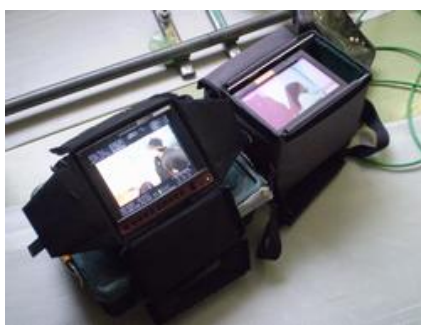
3年6組内を2台のカメラが撮影している様子が小型モニターで見学できた。