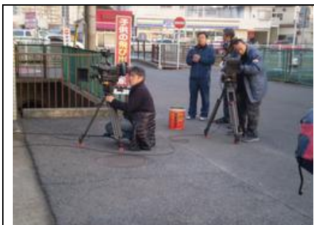
民放と異なる点は、カメラが常時2台で撮影したことである。