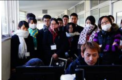
演出 大原監督のモニタを背後より見学させてもらう生徒たちである。